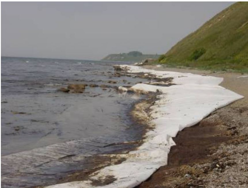
Figur 2.2. Strandduk som används i förebyggande syfte för att skydda strandområde.