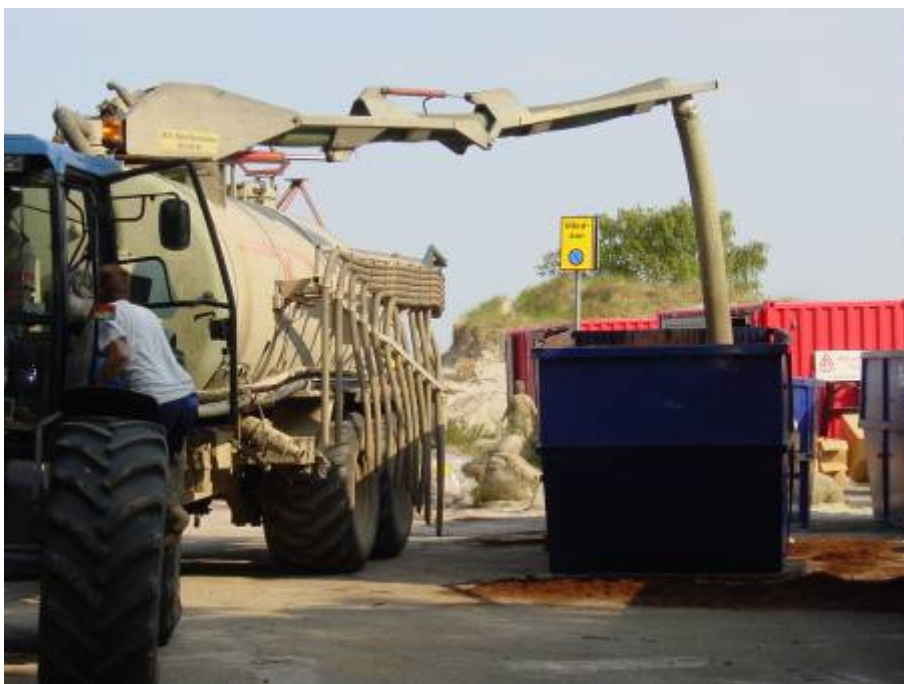
Figur 3.3. Avfallscontainer för förvaring av oljeavfall (Fu Shan Hai- olyckan)