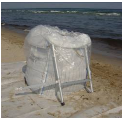
Figur 3.2. Sopsäck för förvaring av oljeavfall. Lagringsplatsen skyddas med ett underlag.

Användning av storsäckssystem för förvaring av uppsamlad olja har ökat senaste tiden. Säckarna är anpassade för uppsamling, transport, tillfällig förvaring samt är staplingsbara. Lagringsplatsen bör förses med ett skyddande underlag.