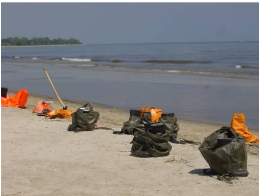
Figur 3.5. För att förhindra sekundär nedsmutsning behövs saneringsarbetet utföras på ett ordnat sätt, med ett säckar/saneringsutrustning på ett visst avstånd från varandra.