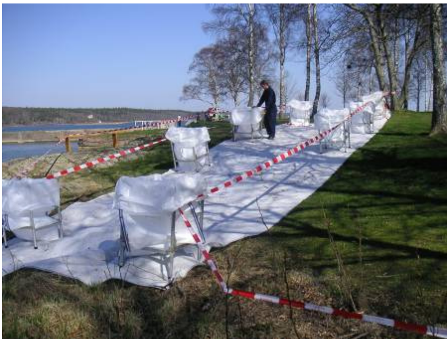
Figur 3.6. Exempel på hur "rena" respektive "kontaminerade" zoner kan utformas rent praktiskt.

Zoner markerat med "rent" respektive "kontaminerat" bör utformas på plats för att undvika sekundär nedsmutsning, se figur 3.6 nedan.