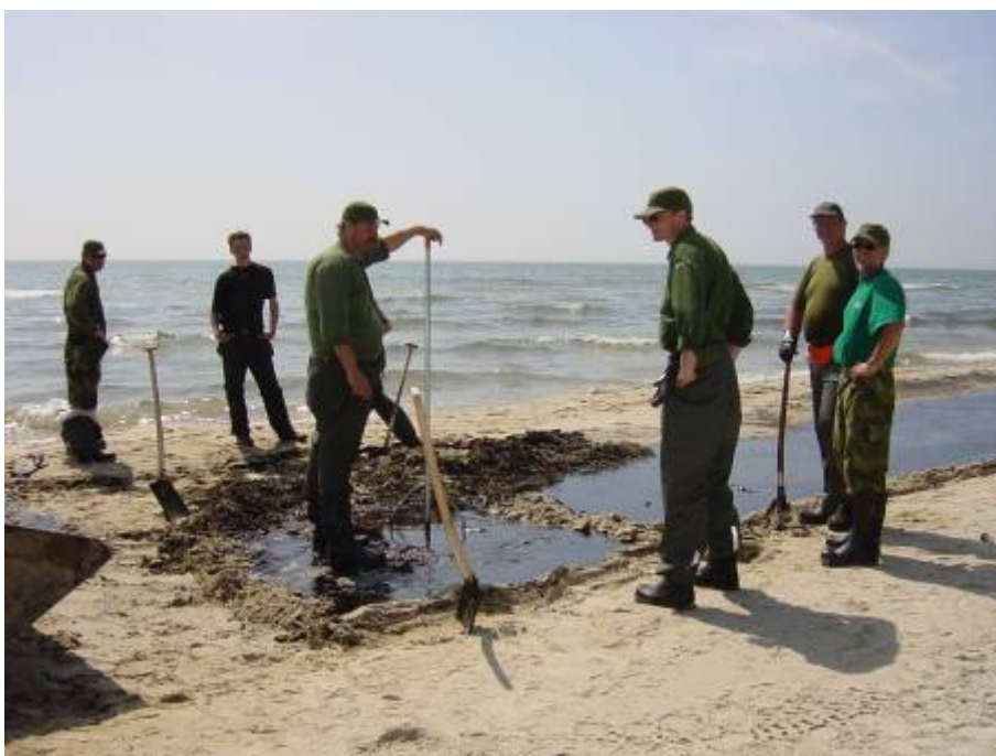
Figur 3.4. Grop för tillfällig förvaring av oljeavfall. Gropen måste förses med ett skyddande underlag för att förhindra kontaminering av grundvatten (Fu Shan Hai- olyckan).