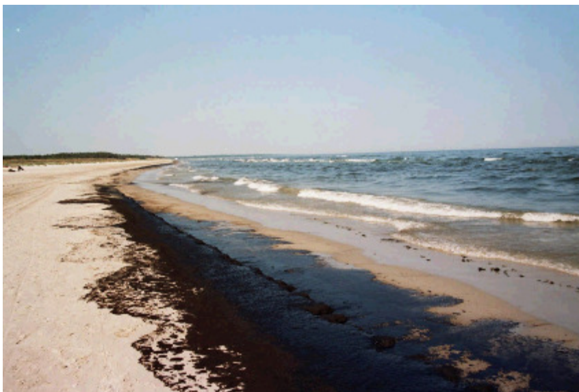
Figur 2.1. Oljepåslag på strand efter Fu Shan Hai- olyckan.

Vid en oljeolycka kommer avfall att uppkomma på olika sätt. Generellt kommer störst mängder avfall att uppkomma om oljan når land. Till havs (där Kustbevakningen är ansvarig myndighet) är prioriteten att förhindra och begränsa utsläppets omfattning genom t.ex. att kvarvarande olja pumpas över till annat fartyg eller att läckande tankar tätas. För att begränsa spridningen används främst länsar och mekaniska metoder för att förhindra att oljan sprids och når land. Till havs uppkommer således oljehaltigt vatten (med varierande vattenhalt) samt kontaminerade länsar som kan behöva rengöras. Det bör noteras att vissa oljor har egenskapen att öka i volym (upp till 5 ggr, 80 % vatten) då de blandas med vatten, s.k. emulsion.