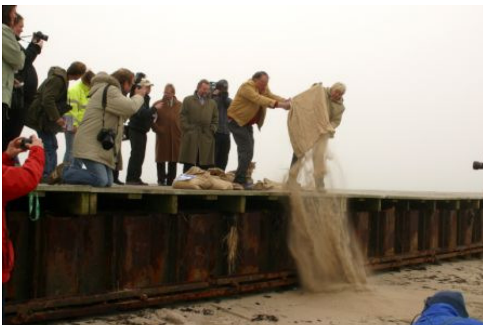
Figur 3.10 Ren sand återförs till Löderups strand.