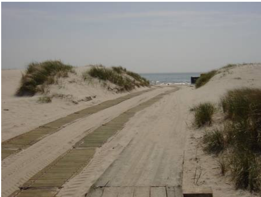
Figur 3.8. Ramper för fordon till strandområdet.

Generellt gäller att avfallsmängderna skall minimeras så långt möjligt. Detta kan uppnås bl.a. genom att: