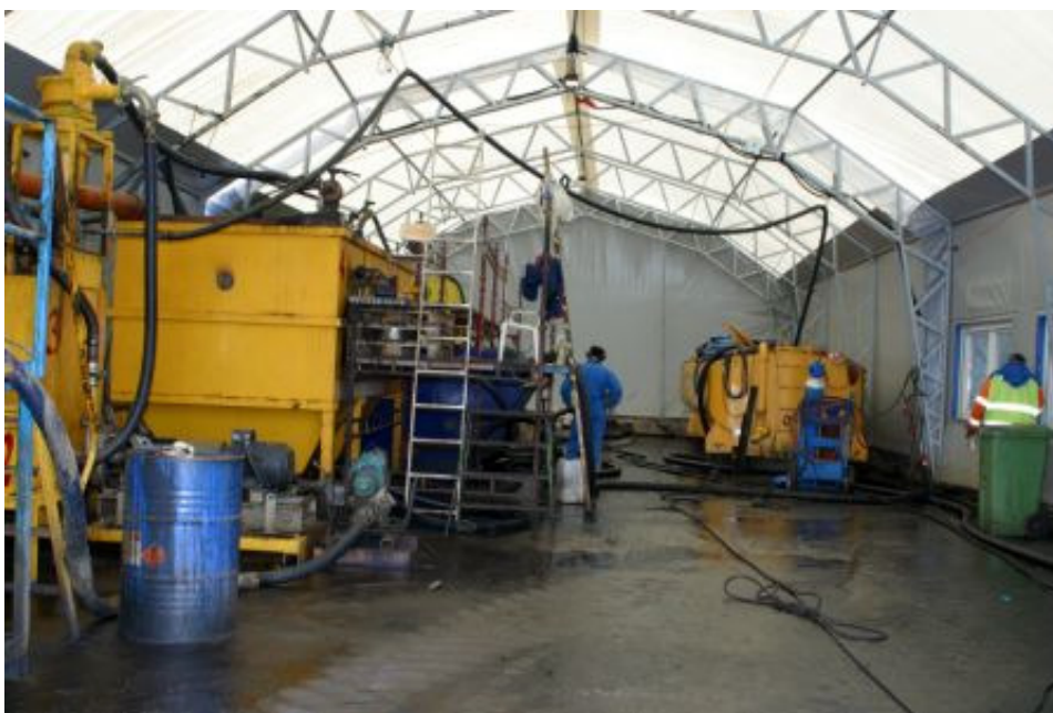
Figur 3.9. Vägverket Produktions anläggning för jord/sandtvätt i Ystad.

områdena. Den förorenade sanden tvättades och återfördes efter behandling till Löderups strand, se Figur 3.10.